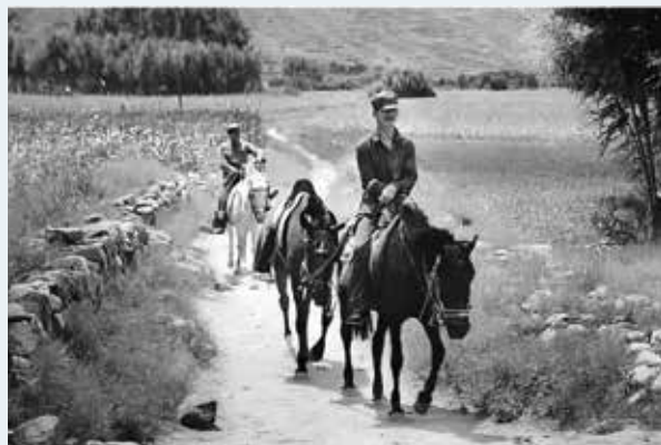
1938年，林迈可在晋察冀抗日根据地与白求恩会面。这是他们一同去往晋察冀军区后方医院的情景，左图为林迈可，右图骑黑马者为贝熙业