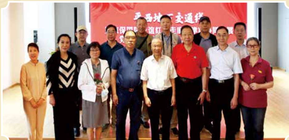
八路军研究会、白求恩精神研究会、海淀区对外友协等单位领导、专家在七一专题活动现场合影