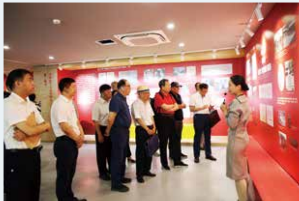
与会各方参观“红色血脉：平西地下交通线主题展”

主持人： 感谢小朋友们的精彩演出。在我们今天上午活动的结尾，感谢在座的所有领导对弘扬党史文化、红色文化工作的大力支持，感谢辛勤的老师用红色文化培育了祖国的花朵。平西