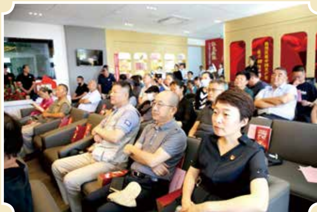
七一专题活动现场