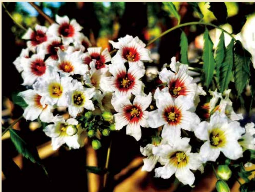
文冠果花