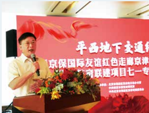
北京市委党史研究室、市地方志办副主任、一级巡视员 张恒彬