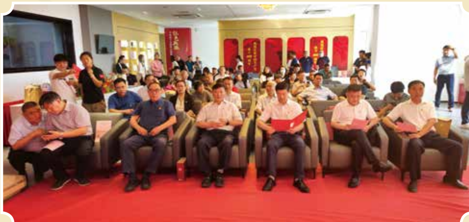
平西地下交通线暨京保国际友谊红色走廊京津冀协同发展党史教育联建项目七一专题活动现场