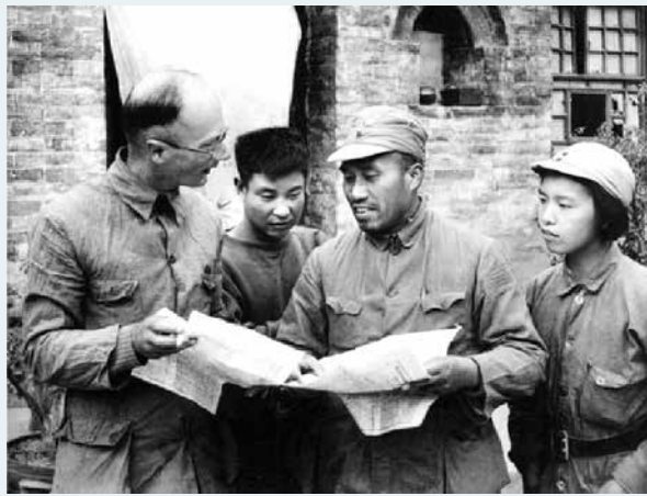
1939年，朱德与林迈可（左一）、肖田（左二）、龚澎（右一）在晋东南八路军总部

会，新招募的军队在操练，兵工厂的工人在紧张的工作，乡村小学校黑板上写着抗日标语，男女平等参政议政，以及根据地人民新颖的文化活动——在露天舞台上演出抗战话剧。