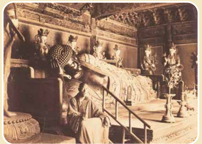
1906 年左右的卧佛寺卧佛铜像