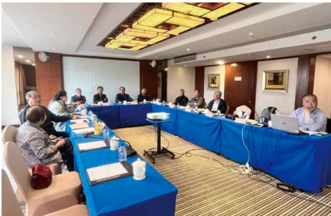
研讨会现场

充分肯定，他指出：该书虽然不是志书，却是按照修志重要意义、原则、方法、作用以及修志时需要注意的问题进行全面客观翔实的记述，尤其是社会生活与民俗现象部分，充分体现出了历史文化的价值，也填补了北京市的空白，同时在设计和排版方面提出了建设性意见。他对《海淀区志拾零》系列丛书的主题策划也表示赞同，认为海淀区自古就人才辈出，应对人物的选择标准进行深入分析并提出指导性意见。