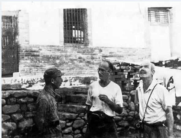
1939年8月，林迈可（中）与白求恩（左）、聂荣臻在晋察冀军区司令部