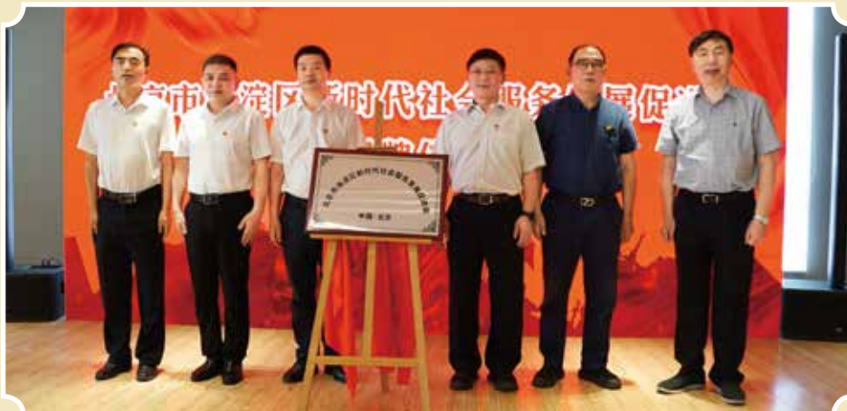
与会领导、专家为北京市海淀区新时代社会服务发展促进会揭牌