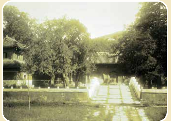
1906 年左右的卧佛寺天王殿