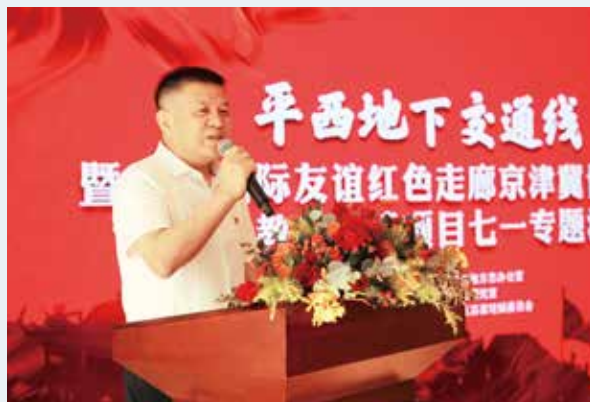
保定市委党史研究室主任王国勇