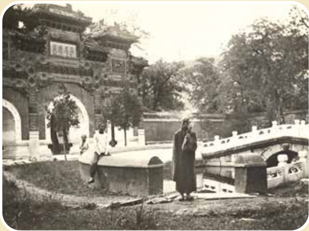
1906 年左右的卧佛寺琉璃牌坊后石桥