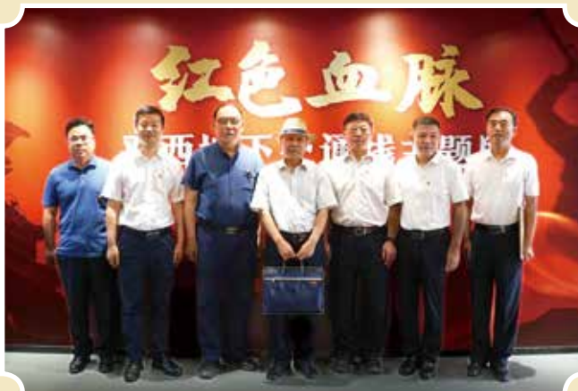
与会领导、专家在“红色血脉：平西地下交通线”主题展现场合影