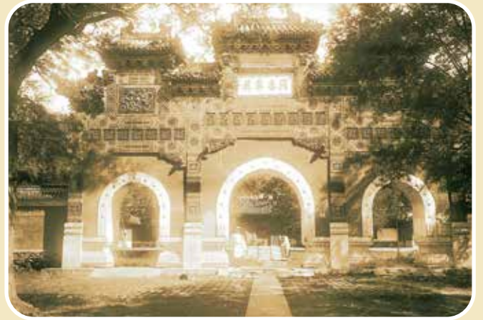
1906 年左右的卧佛寺门前琉璃牌坊