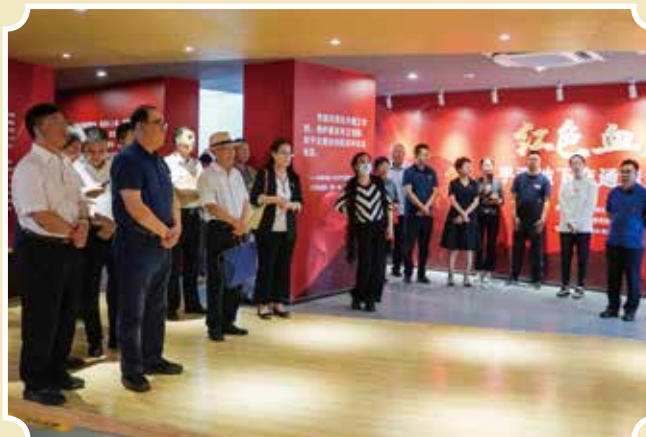
与会领导、专家参观“红色血脉：平西地下交通线”主题展