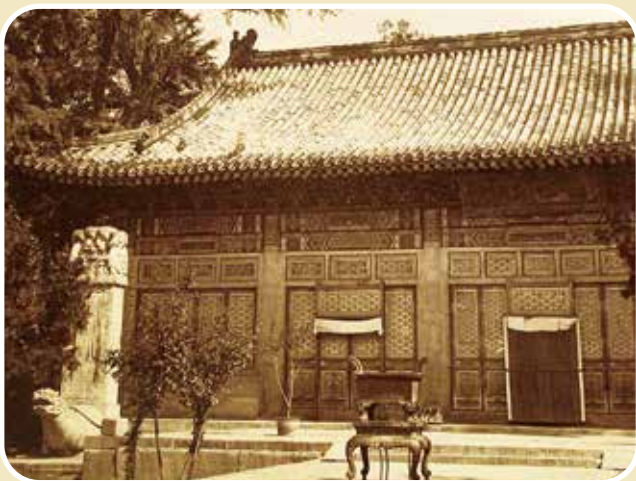
1865 年左右的卧佛寺大殿