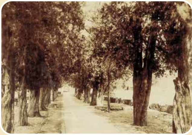
1890 年左右的卧佛寺神路