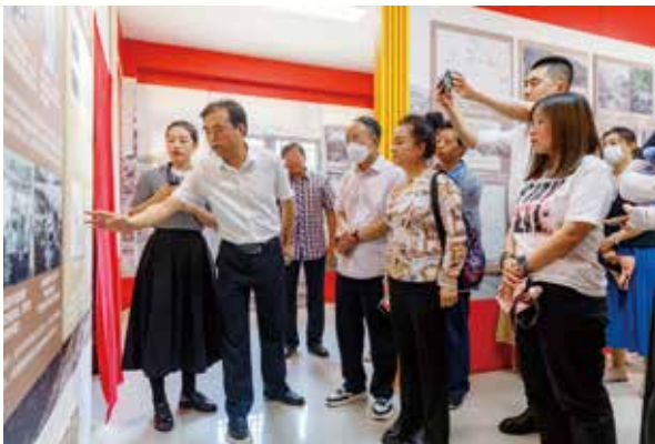
参观《平西抗战红色印记》展